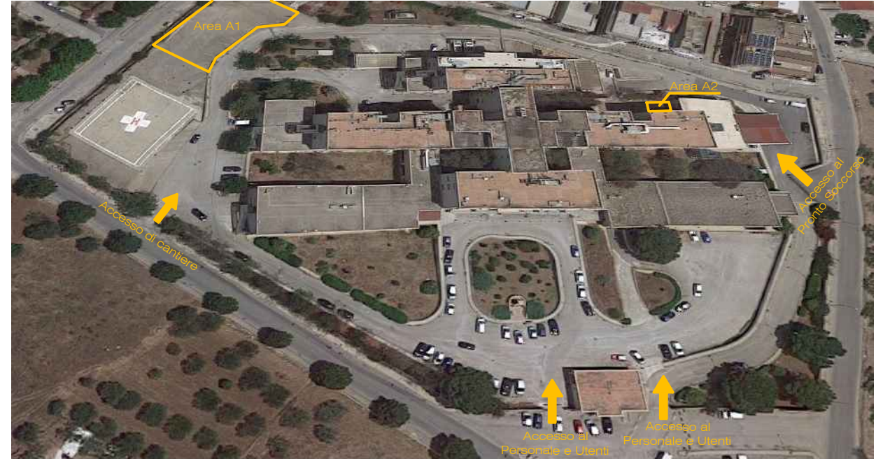
Aerofoto Presidio Ospedaliero con indicazione Accessi e aree di cantiere