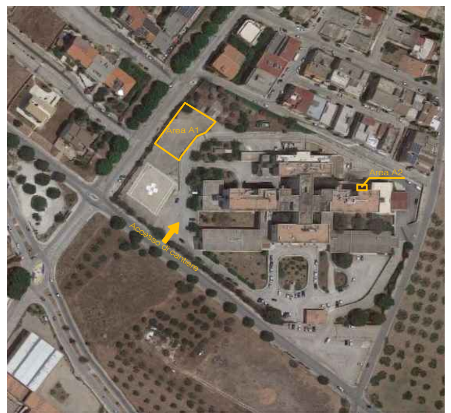
Aerofoto Presidio Ospedaliero con indicazione Accessi e aree di cantiere